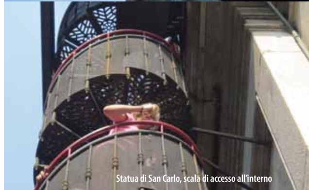
Statua di San Carlo, scala di accesso all'interno