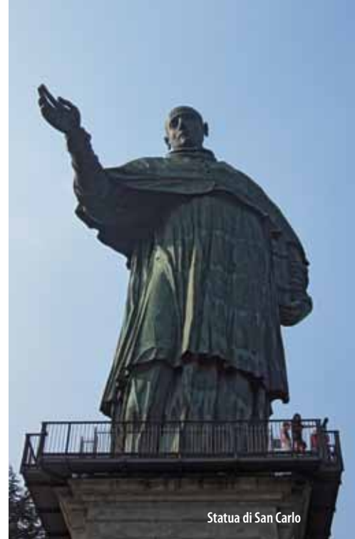
Statua di San Carlo

Der Heilige Carlo Borromeo (2. Oktober 1538 - 3. November 1584) war ein Bischofsmuster in einer historischen Zeit von Unordnung und Korruption und eine Hauptgestalt während des Konzils von Trento. Der im Luxus geborene Sohn adeliger Margherita Medici von Marignano und Giberto Borromeo, die zur Familie Borromeo gehörten, verzichtete auf ein an Privilegien reiches Leben, um seinen Wunsch zu folgen, der Kirche mit Frömmigkeit zu dienen. Der Heilige gebrauchte seine Stellung und sein Prestige nicht für sich selbst sonst von der Kirche zugunsten. Er war 22 Jahre alt, als er Kardinal und persönlicher Sekretär vom Onkel-Papst Pius IV. (Giovanni Angelo Medici) wurde. Schnell bekleidete der Heilige das Amt von päpstlichem Diplomat und Oberaufseher wichtiger Weihen mit starkem Temperament, Strenge und absoluter Religionseinhaltung. Während des Konzils wurde er Priester geweiht und nach wenigen Monaten im Jahr 1564 Erzbischof und Kardinal Mailands erwählt. Diese Diözese war von einer gefährlichen Zersetzung charakterisiert. Seine strengen Reformen richteten sich nach den Dekreten des Konzils und waren den Grund, dafür er einen Anschlag von einer Gruppe unzufriedener Mönche erlitt. Dennoch haben die wunderbare spirituelle Richtigkeit, die zahlreichen Pastor-Besuche und seine Askese ein unauslöschliches Zeichen gelassen. Er starb mit 46 Jahren und wurde 1610, 26 Jahre später heiliggesprochen.