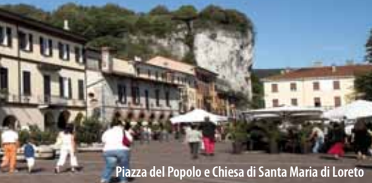
Piazza del Popolo e Chiesa di Santa Maria di Loreto

as well as one of the five entrances to the town. Thanks to the abundance of goods of all kinds, especially fruits and vegetables from the hills of Alto Vergante, it used to be the most important weekly market of the area. The market was already mentioned in some documents dating to 1173, as an event of great attraction. From the square, you can reach the Rocca Borromeo along a 1km long paved road. St. Charles Borromeo was born in one of