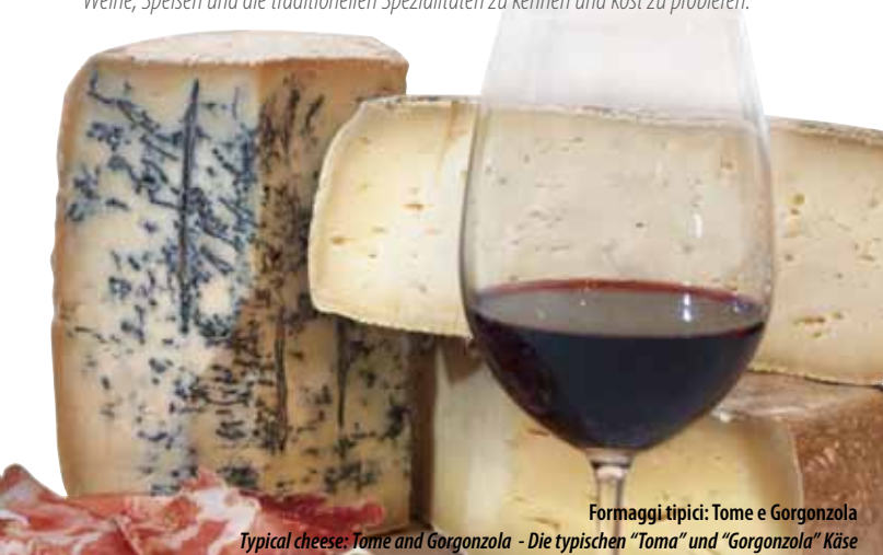
Formaggi tipici: Tome e Gorgonzola

Der an den Eigentümlichkeiten unserer Gegend interessierte Tourist verpasst gar nicht, lokale Weine, Speisen und die traditionellen Spezialitäten zu kennen und kost zu probieren.