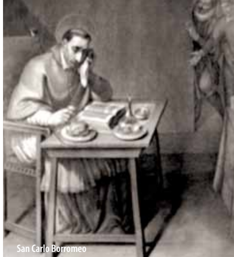
San Carlo Borromeo

Nel 1439 Vitaliano Borromeo ottenne vari feudi, tra i quali anche Arona, dal duca di Milano Filippo Maria Visconti, in seguito ai debiti contratti dai Visconti con le sue banche. La Famiglia Borromeo possiede uno stemma costituito da diversi simboli: l'originario scudo a bande, il liocorno (emblema della duplice natura del Cristo e simbolo di coraggio), la corona (la concessione del titolo di conte), il freno o morso dei cavalli (la vittoria della ragione sull'impeto animale), i cedri (simbolo delle bellezze naturali del Verbano) e il motto "UMILITAS" che San Carlo inserì nel proprio stemma cardinalizio. Altri elementi che compaiono nello stemma sono: il cammello nella cesta (simbolo