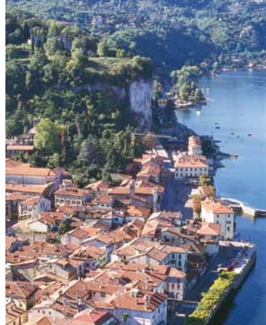
Veduta di Arona e della Rocca

Am Ende des XII. Jahrhunderts wurde die Burg, auf die die Zivilautorität Mailands ihren Einfluss vergrößerte, noch einmal befestigt, um eventuelle Angriffe der mit Federico Barbarossa verbündeten Städte zu behindern.