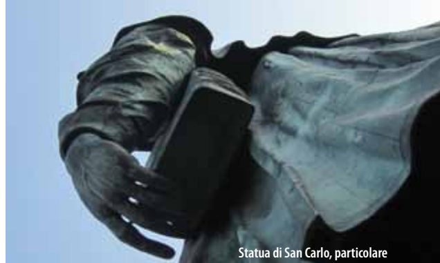
Statua di San Carlo, particolare

St. Charles Borromeo (2th october 1538 - 3rd november 1584) was a central figure in the Council of Trent and a model of such leadership in difficult times of disorder and corruption. He was born into luxury, the son