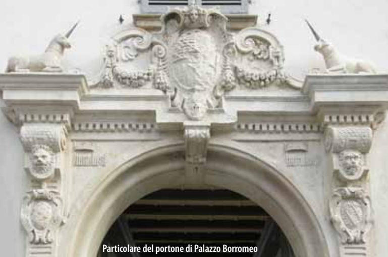
Particolare del portone di Palazzo Borromeo

from Tuscany, in the late fourteenth century. In 1439 Vitaliano Borromeo obtained several fiefs, among which that of Arona, from Filippo Maria Visconti, Duke of Milan as a result of the debt incurred by the Visconti with his bank.