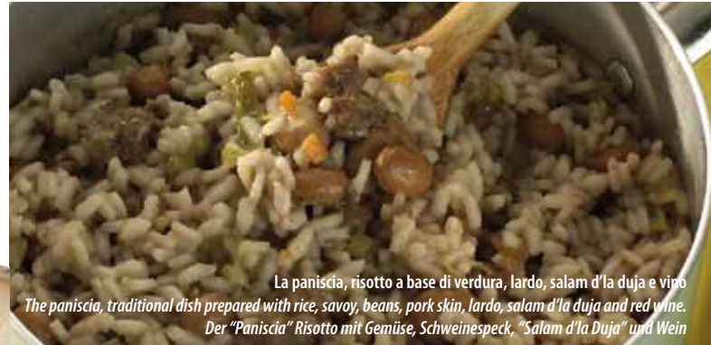
La paniscia, risotto a base di verdura, lardo, salam d'la duja e vino

Typical cheese: Tome and Gorgonzola - Die typischen "Toma" und "Gorgonzola" Käse