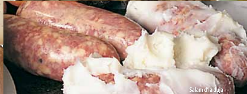
Salam d'la duja

Der "Paniscia" Risotto mit Gemüse, Schweinespeck, "Salam d'la Duja" und Wein