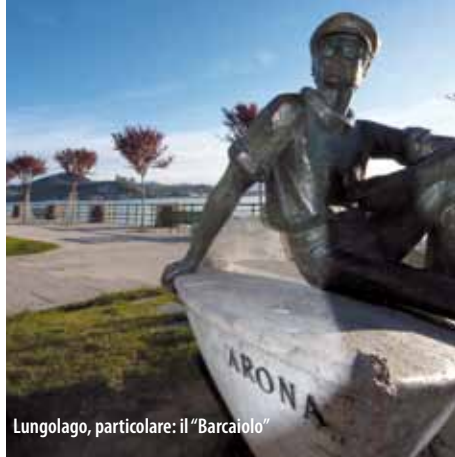
Lungolago, particolare: il "Barcaiolo"

From Piazza del Popolo you can walk along the most picturesque promenade of Arona, known by the young for the many bars and restaurants along Corso Marconi and by the tourists that from here enjoy the beauty of the place. With the Rocca Borromeo behind you, you can walk through a pergola of wisteria. After a short while, you reach the docking of Arona, the starting point of Navigazione Lago Maggiore to other famous lake tourist sites. The pedestrian path widens, becoming a real tourist attraction: relaxation areas with benches, a grand fountain within the shaded green area and a playground. Along this way you reach the tourist office where you can obtain useful information for your stay in Arona. On the opposite side is the Train Station , once located by the lake. Since June 1855, the old station is connected permanently to the towns of Novara, Mortara and Alessandria, allowing you