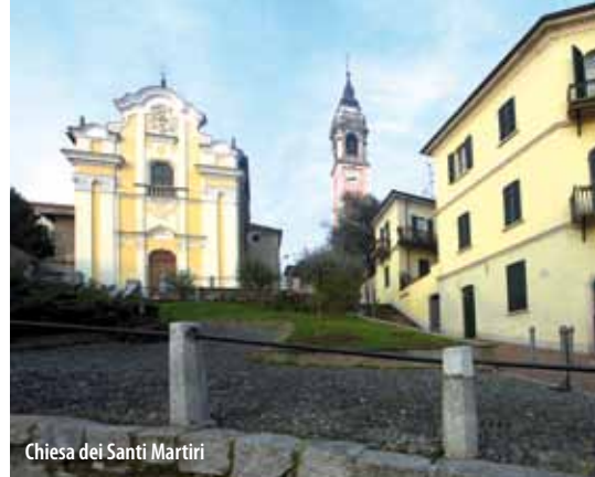
Chiesa dei Santi Martiri

Il percorso si snoda interamente nell'area pedonale dove forte è il sincretismo che si crea tra l'arte e la presenza di attività commerciali che vivacizzano le vie del centro. La Collegiata della Natività di Maria Vergine , ricostruita secondo il progetto dell'architetto Filippo Cagnola nel XV secolo, custodisce